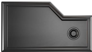
Lavello Diade Gun Metal 3028 006